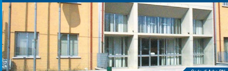
Sede di Arba PN