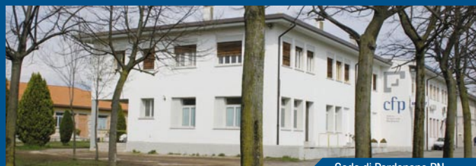
Sede di Pordenone PN

I corsi di istruzione e formazione sono riconosciuti e finanziati dalla