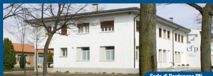
Sede di Pordenone PN

I corsi di istruzione e formazione sono riconosciuti e finanziati dalla